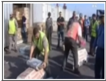
حجز كميات هائلة من