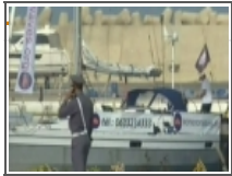
سفينة الإجهاض الهولندية بالمغرب على الجزيرة 2012/10/04

الجامعة تغري الأسود بـ20 مليونا للتأهل إلى كأس إفريقيا 2012/10/02