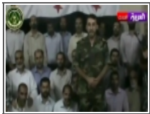
48 ساعة تحدد مصير الرهائن الإيرانيين في سوريا 2012/10/04