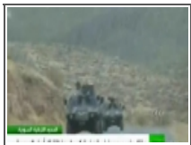
مقتل سوريين في قصف تركي لمنطقة تل أبيص 2012/10/04