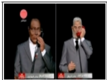
بنكيران والخوف من الحسد 2012/10/04