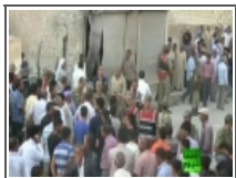
أثار الدمار على الأراضي التركية بعد القصف السوري 2012/10/04