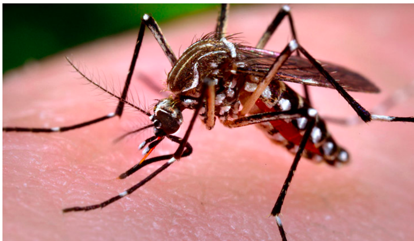
Mosquito aedes aegypti, causante del zika.

El virus del zika está asociado a malformaciones cerebrales en el feto y como en muchos países latinoamericanos donde la presencia del virus ha sido declarada como “grave” y el aborto voluntario está restringido o directamente prohibido, la Organización Mundial de la Salud (OMS)