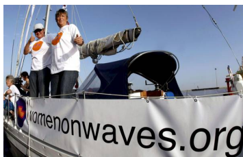
De abortusboot van de Nederlandse stichting Women on Waves is onderweg naar de haven van Smir in Marokko, 2008.