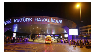
Elevan a 39 muertos y 239 heridos la cifra de víctimas por atentado en Estambul