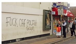
Tras el Brexit, aumentan quejas por xenofobia en Reino Unido