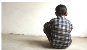
Para 2030, 69 millones de niños podrían morir por causas evitables: UNICEF