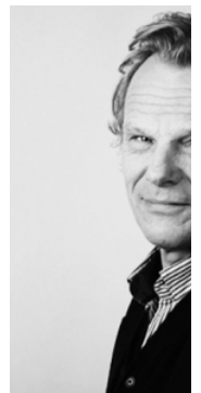
Feiten over risico