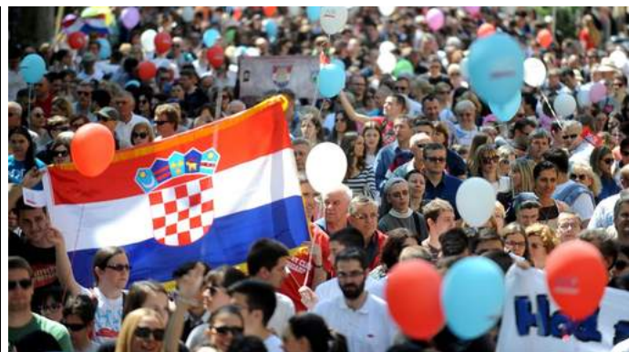
Plusieurs milliers de personnes, dont l'épouse du Premier ministre croate, ont défilé samedi à Zagreb contre l'avortement, et des centaines ...

Plus d'infos sur Avortement , Irlande du Nord , Irlande , Famille , Grossesse