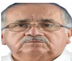
Democracia y Fuerzas Armadas