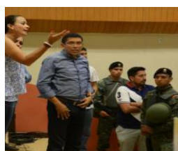
Marcela Aguiñaga denuncia "fraude" por "ineptitud" del presidente del CNE

Suscríbete y recibe más noticias directamente en tu correo