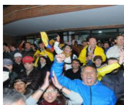
Segunda vuelta será el 2 de abril, pero aún no culmina el conteo de votos