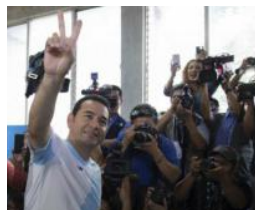
El humorista Jimmy Morales gana la presidencia de Guatemala