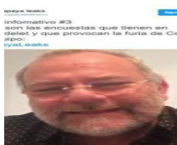
Rafael Correa: 'Los capayaLeaks tuvieron impacto electoral'