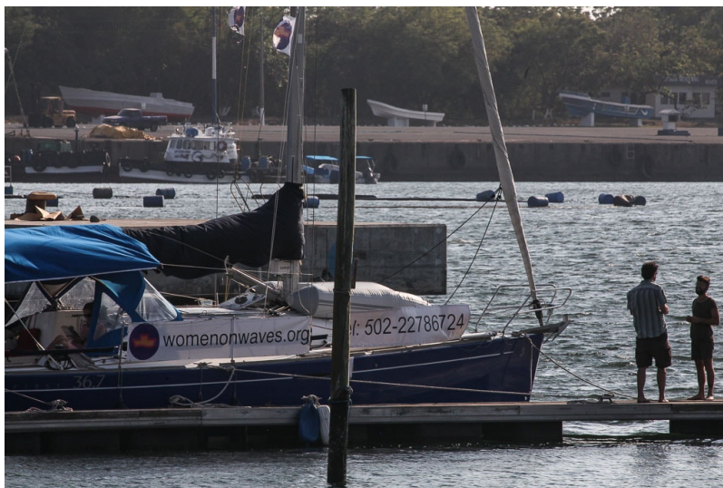
El barco de Women on Waves, en el Puerto el viernes pasado.

POR MARTÍN RODRÍGUEZ PELLECCER / 28 FEBRERO, 2017