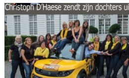
N-VA Aalst heeft een wonderwapen