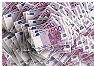
Le soluzioni migliori per un prestito veloce Social Excite