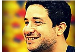
Imparare qualsiasi lingua grazie a questi 5 trucchi Babbel