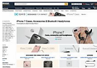
A pochi minuti dal lancio ufficiale Amazon si lascia sfuggire le immagini di iPhone 7