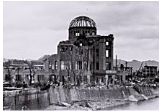
Che succedrebbe sulla Terra se domani tutta l'umanità scomparisse