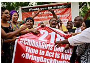
Le 21 studentesse rapite da Boko Haram e poi liberate si sono ricongiunte alle loro famiglie