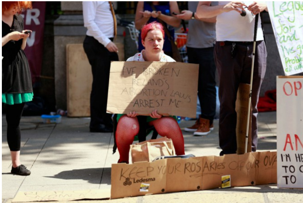
Una manifestazione per la legalizzazione dell'aborto in Irlanda. L'interruzione di gravidanza è vietata nel Nord Irlanda.

ULTIM'ORA: #Germania , la BASF ha dichiarato che una persona è morta nelle esplosioni di oggi: https://t.co/1mdRyJvWIA