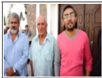
تصريح متطوعو تحرير سبتة ومليلية

بلاغ صحافي: حركة مالي ومنظمة نساء عى الأمواج