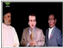
برنامج الكباش والقبض الآخر 2012/10/05