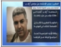
سحب اعتماد بركسي بالمغرب على الجزيرة 2012/10/05