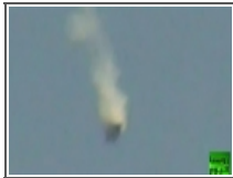
لحظة إسقاط مقاتلة الجيش السوري بريف دمشق 2012/10/05