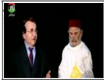
بن كيران في قناة الحفيرة 2012/10/06