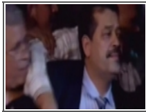
شباط يطالب بحكومة انتلافية 2012/10/05