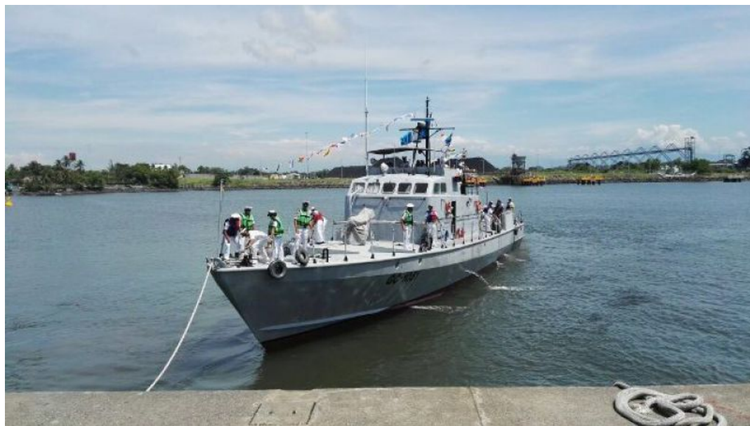
Ejército de Guatemala