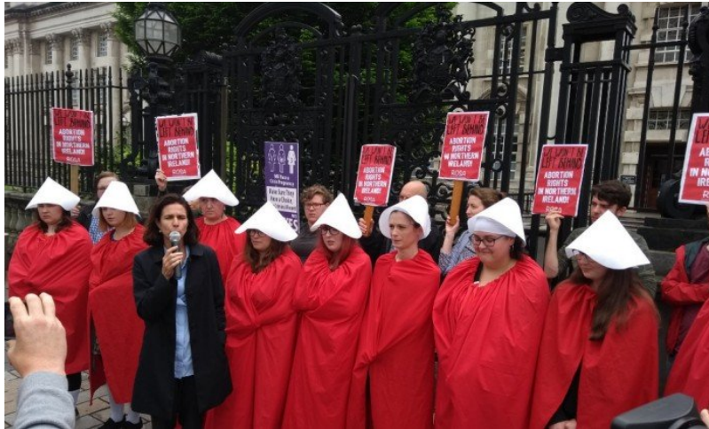
Manifestantes vestidas de "aia" protestam contra a criminalização do aborto na Irlanda do Norte

capotes brancos inspirados no livro "O conto da Aia". No romance, mulheres em idade fértil são forçadas a engravidar a qualquer custo. Roupas similares foram usadas por manifestantes pró-escolha nos Estados Unidos em junho do ano passado.