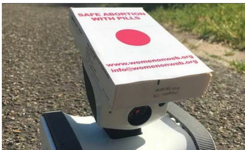
Um pequeno robô operado à distância foi usado para entregar pílulas abortivas para mulheres na Irlanda do Norte

Um pequeno robô operado à distância entregou pílulas abortivas hoje na porta do tribunal de Belfast, capital da Irlanda do Norte, onde o aborto é proibido por lei. Um operador e uma médica que estavam em Amsterdã, na Holanda, controlavam o equipamento. Médicos da Irlanda do Norte são proibidos de prescrever pílulas abortivas — fora casos de risco à vida da gestante ou quando a gravidez pode lhe causar doenças físicas ou mentais — mas como as pessoas que comandavam o robô estavam em Amsterdã, a entrega das pílulas não foi contra nenhuma lei. O evento foi transmitido ao