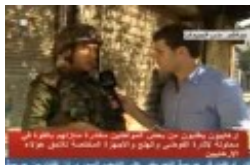
La guerre civile en Syrie : Allah Akbar contre Allah Akbar !