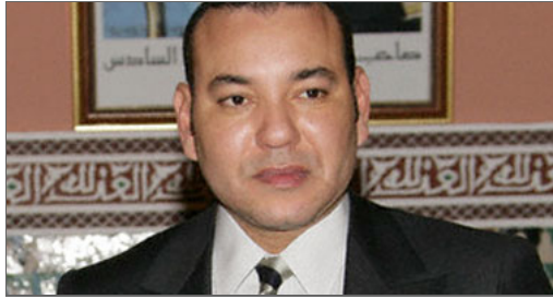
العهال المغربي الملك محمد السادس