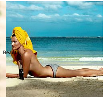
Un mois avant la plage : le régime express qui fonctionne

http://www.lefigaro.fr/celebrites/natalie-portman-fait-sa-declaration-damour-a-israel-050615-96865