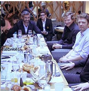
L'art à fonds

http://madame.lefigaro.fr/celebrites/mariage-de-la-fille-de-lancien-vice-premier-ministre-libanais-150615-97001