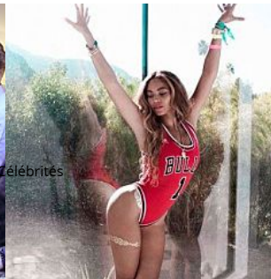
Beyoncé révèle son secret minceur et agace ses fans

http://www.lefigaro.fr/celebrites/l-art-a-fonds-160615-97011