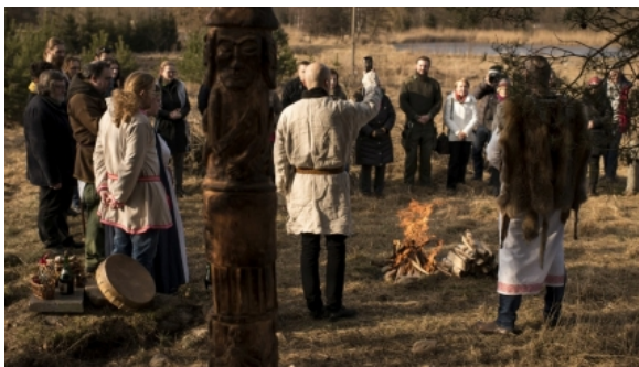
Rodzimowiercy zwiernają szeregi. Pogańska ofensywa na katolickiej ziemi