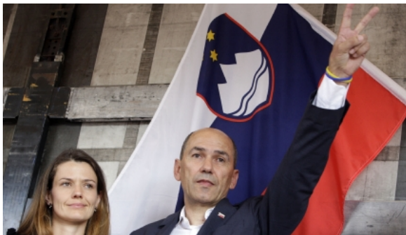
Przedterminowe wybory parlamentarne w Słowenii. Zwycięży polityk przeciwny imigracji?