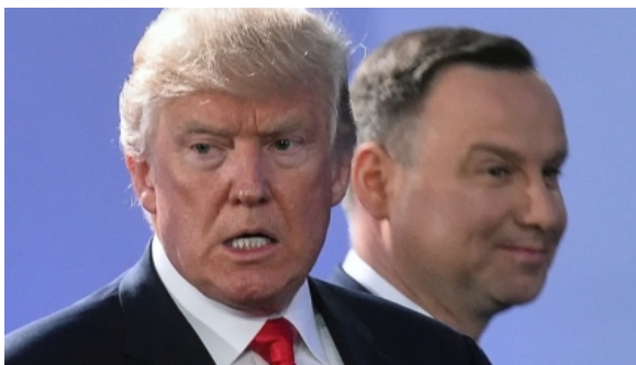
Trump sprawił, że Polska ostatecznie przegrała II wojnę światową?