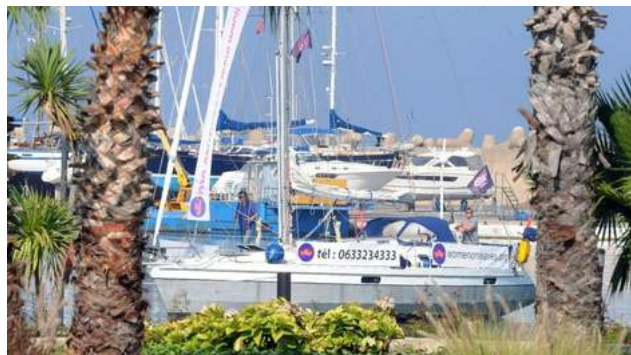
Women on Waves boot in de haven van Smir in Marokko.