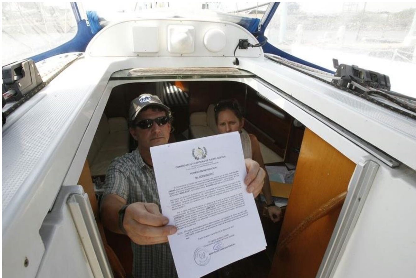
Médicos que practicarían abortos muestran permiso de navegación en Guatemala.