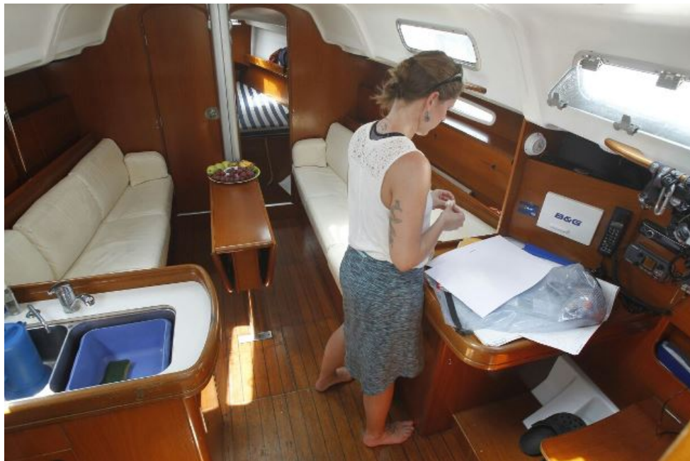
El barco que ofrece practicar abortos tiene equipo médico para efectuar los procedimientos.

El presidente de la Conferencia Episcopal de Guatemala, Gonzalo de Villa, calificó como asesinatos la práctica del aborto que promueve Women on Waves.