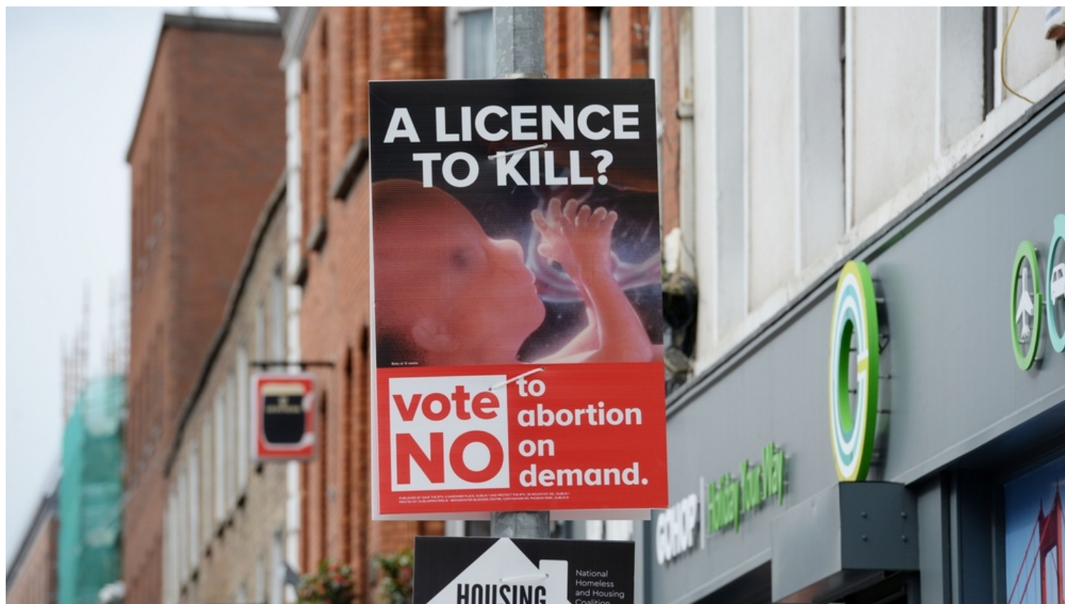
Cartel de propaganda del "no" al aborto en Irlanda.