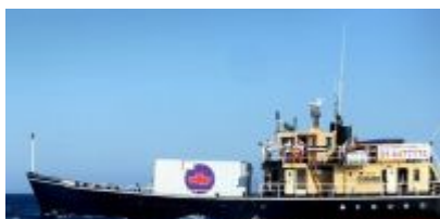
Le navire de l'association Women on waves.

Le débat sur l'avortement est relancé. Sur une invitation du l'ONG Mali (Mouvement alternatif pour les libertés individuelles), l'association néerlandaise Women on waves s'apprête à jeter l'ancre cette semaine, au Maroc. Des opérations d'arrêts volontaires de grossesses sont prévues dans les eaux internationales.