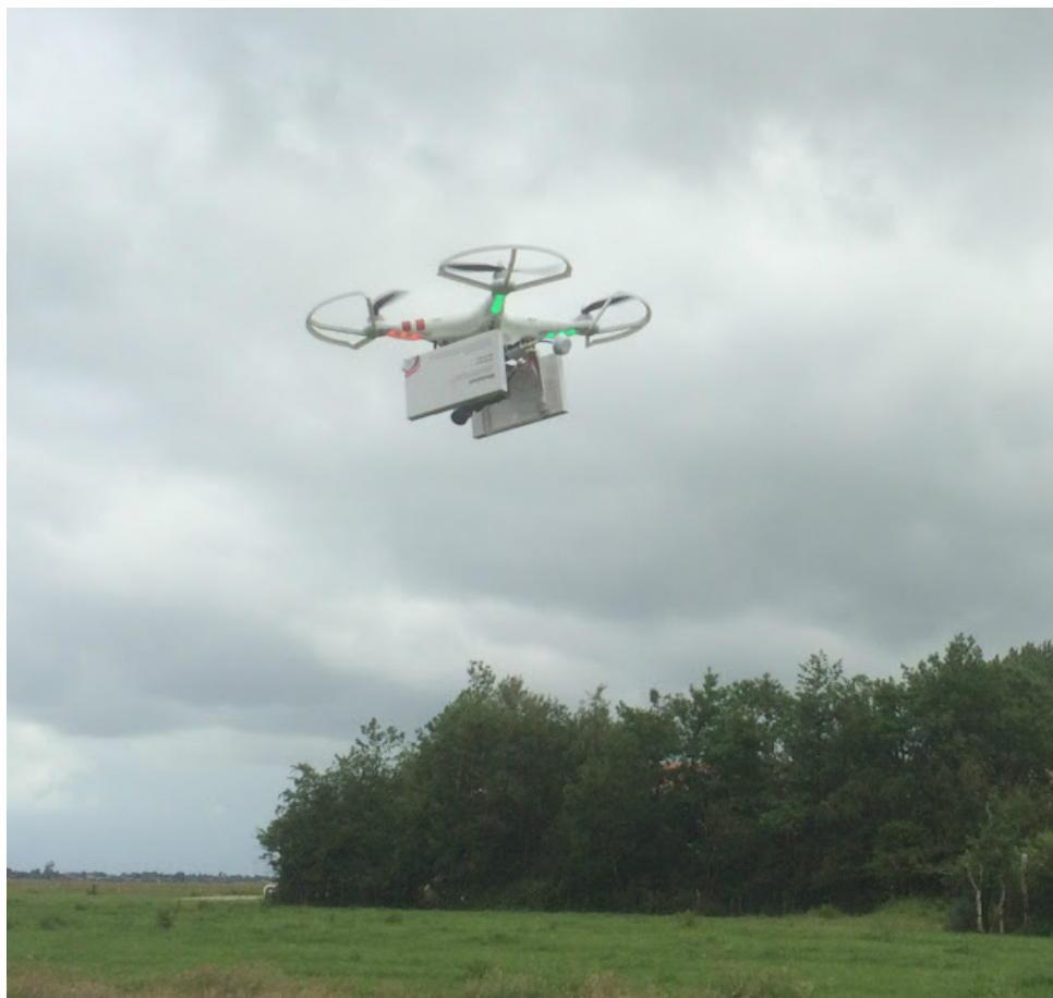
El dron que muestran en su página

La organización internacional Women on Waves anunció que el próximo sábado 27 de junio volará un dron que contiene paquetes de pastillas abortivas de Fráncfort del Óder, la ciudad alemana, a Slubice en Polonia. Los pueblos se ubican uno enfrente del otro y los separa un río , el Óder. La geografía resulta fundamental en el caso de este esfuerzo, ya que uno de los requisitos para volar un dron sin que sea necesaria una autorización gubernamental es que en todo momento esté bajo la mirada de quien lo controla. Por eso el Óder es el escenario perfecto: en muchos de sus puntos, son menos de 300 metros los que separan una orilla de la otra. Se tratará de un viaje sencillo, pero no por ello menos importante: con este acto, de ser un símbolo del terrorismo de Estado, el dron pasará a ser también un arma para el ejercicio de derechos. En este caso, los derechos reproductivos de las mujeres.