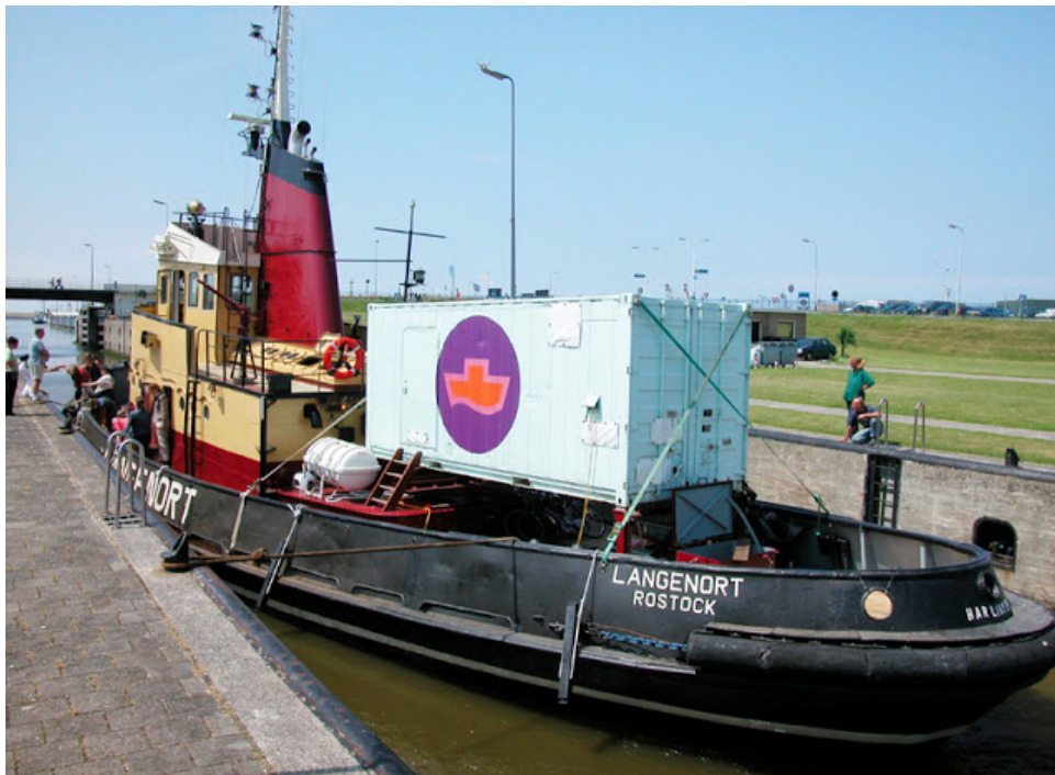
El barco Langenort antes del viaje a Polonia (2003)

Women on Waves , una organización no gubernamental sin fines de lucro, fue fundada en 1999 por Rebecca Gomperts, una médica holandesa (que también estudió arte ). El proyecto inicial no me deja de fascinar: convirtieron un contenedor de carga en una clínica ginecológica móvil (el diseño se lo deben al artista Joep van Lieshout ). El objetivo era incorporar el contenedor a un barco y navegar a países en los que el aborto estuviera criminalizado prácticamente sin excepción. En el puerto, siempre en coordinación con organizaciones locales, abordarían a mujeres del país en cuestión. De ahí viajarían a aguas internacionales, a 12 millas de la costa, y les ofrecerían a las mujeres información, talleres, entrenamiento y servicios de anticoncepción y de interrupción del embarazo. El barco, al estar registrado en Holanda, se regiría por su ley, misma que permite el aborto hasta el momento de la «viabilidad» del feto (por lo general, hasta las 24 semanas del embarazo, aunque la mayoría de las intervenciones se realizan antes de la semana 22). Tan cerca de los pro-vida y tan lejos de su poder; tan lejos de los pro-choice y tan cerca de su cobijo. Vaya manera de resignificar los límites y los alcances de la territorialidad del derecho. Gomperts lo describe como «desafiar la ley, sin quebrantarla».