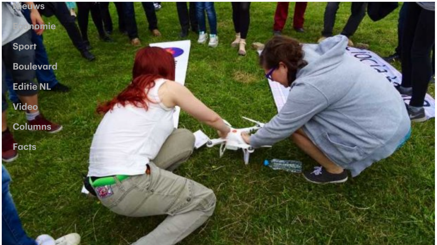
Drone met abortuspillen geland in Polen