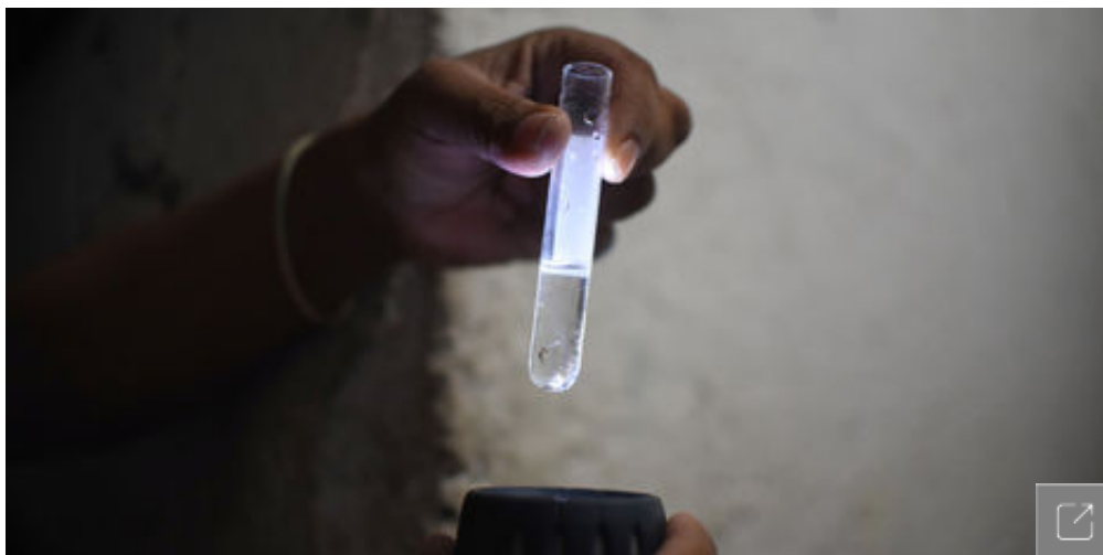
Latinoamérica coordina plan de lucha contra virus del Zika

El informe divide los países latinoamericanos entre aquellos que han tenido casos autóctonos de transmisión de zika y los que no, así como aquellos que han emitido recomendaciones de retraso del embarazo y lo que no lo han hecho.