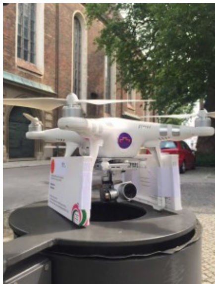
Le drone ayant servi à délivrer des pilules abortives en Pologne.

L'opération communication de l'ONG Women on Waves en juin 2015 : faire livrer des pilules abortives en Pologne afin de dénoncer l'interdiction de l'interruption volontaire de grossesse (IVG) dans ce pays.