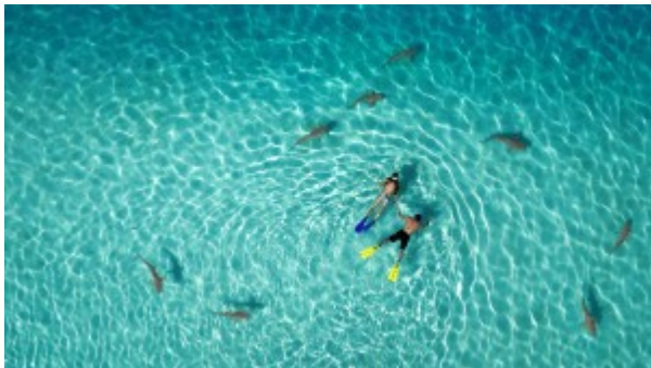
Une des photos gagnantes du concours. Pour voir le reste : http://www.dronestagr.am/contest/