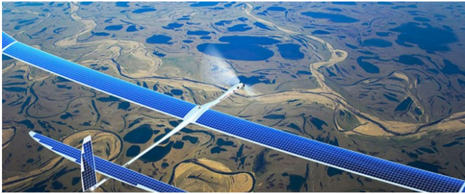
Un drone du projet Internet.org

VOUS ÊTES ICI : Accueil » Actualité » Les drones dans les business model en 2015