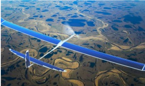
Un drone du projet Internet.org