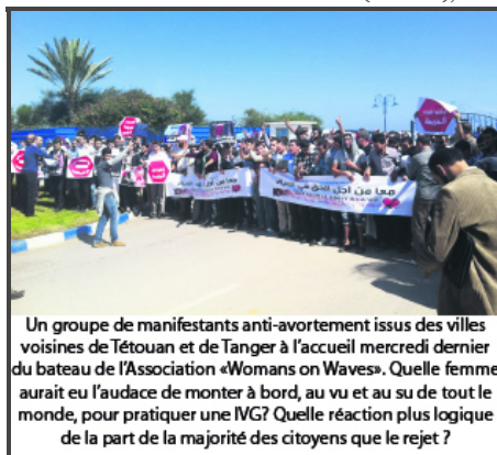
Un groupe de manifestants anti-avortement issus des villes voisines de Tétouan et de Tanger à l'accueil mercredi dernier du bateau de l'Association «Womans on Waves». Quelle femme aurait eu l'audace de monter à bord, au vu et au su de tout le monde, pour pratiquer une IVG? Quelle réaction plus logique de la part de la majorité des citoyens que le rejet ?

Qu'une société décide pour des raisons morales d'interdire l'avortement ou de le limiter à des cas extrêmes, soit, cela peut se discuter, en interne, entre tenants du droit à la vie et ceux du droit à la liberté de choix... Toutes les religions monothéistes frappent l'avortement d'interdit moral. Dans le judaïsme, la tendance orthodoxe le limite à des cas exceptionnels comme la mise en danger de la vie de la mère; tandis que l'orientation libérale l'étend, sans l'encourager pour autant, à quelques autres facteurs comme la santé psychique dans le cas de viol à titre d'exemple. Dans le christianisme qui prône lui aussi le natalisme, où la relation sexuelle dans un couple ne se concevait pas sans l'idée de procréation (et non de plaisir) et où même la contraception sous toutes ses formes a rencontré de grandes barrières émanant des autorités religieuses, il va sans dire que l'avortement est strictement banni, à des degrés divers selon les Eglises, allant jusqu'à l'excommunication en milieu catholique pour donner une idée de l'interdit. Dans un pays comme la France, la pratique de l'avortement est considérée en 1942 comme un crime contre la sûreté de l'État et jugé par un tribunal d'exception. Encore aujourd'hui, l'avortement est strictement interdit (à Malte), autorisé uniquement dans le cas où la vie