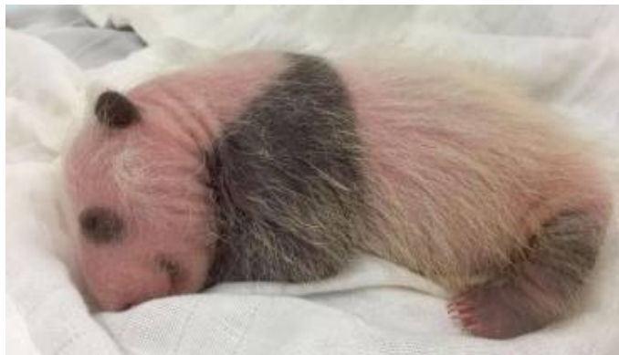
© 20 juin 2016 Le bébé panda de Pairi Daiza prend des couleurs