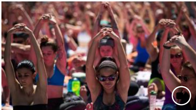
© 21 juin 2016 Des milliers de fans de yoga à Times Square pour la Journée mondiale du Yoga