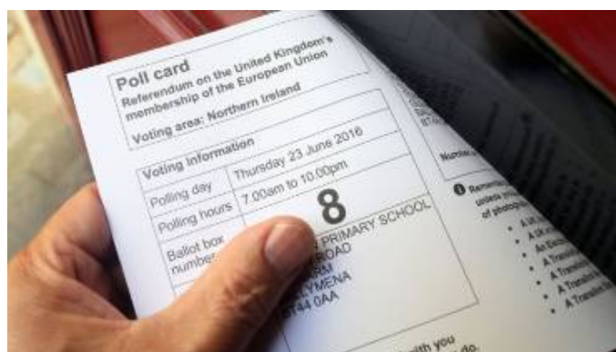
⌚ 22 juin 2016 Le Brexit pratique: qui pourra voter, où, quand et comment?