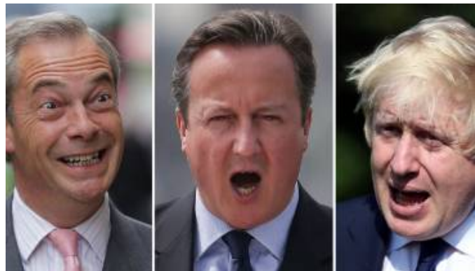
⌚ 08h35 Le Brexit: une campagne "d'insultes et d'injures jamais vue"