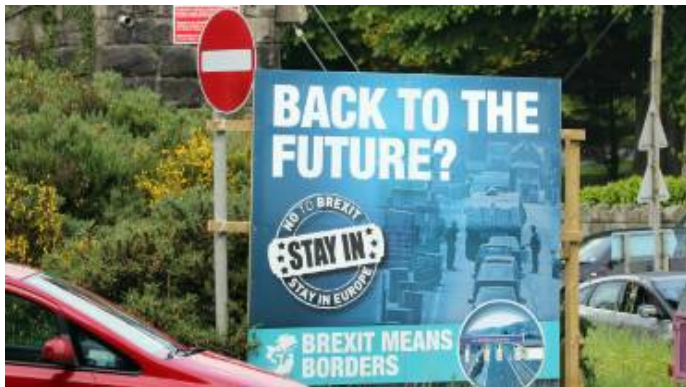
⌚ il y a 6 minutes Brexit: la question écossaise et les inquiétudes irlandaises