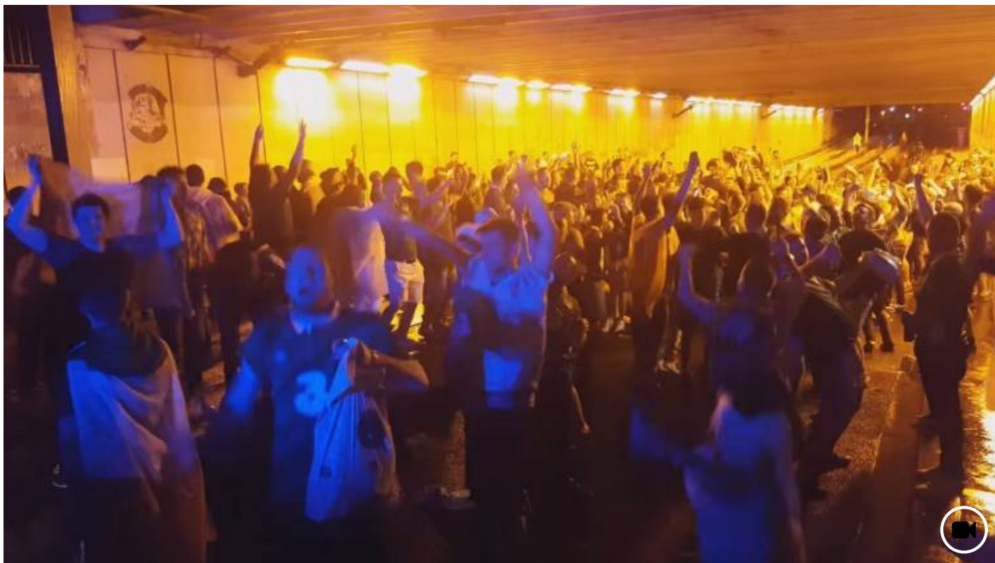
© 20 juin 2016 Euro 2016: La bonne humeur bruyante des Irlandais séduit les Bordelais