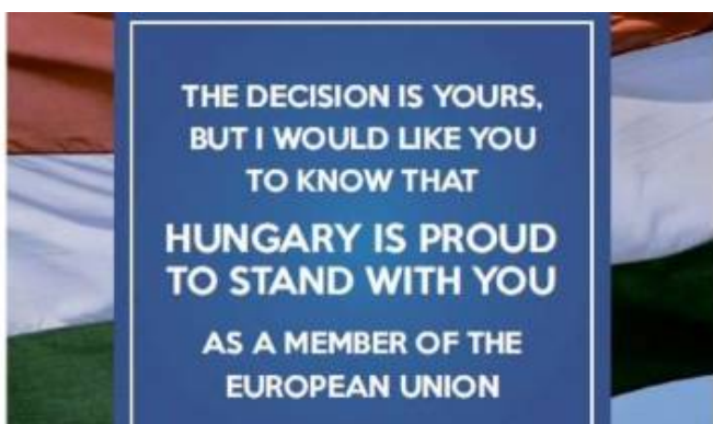
⌚ 10h08 Brexit: l'euroseptique Viktor Orban soutient le maintien du R-U dans l'UE