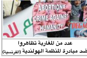
عدد من المغاربة تظاهروا ضد مبادرة المنظمة الهولندية (الفرنسية)