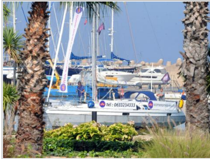
سفينة الإجهاض الهولندية رست بميناء سمير شمال المغرب

قال مسؤولون عن "سفينة من أجل الإجهاض" الهولندية التي أعلن عن وصولها الخميس إلى ميناء سمير شمال المغرب، إنها موجودة فعلا "منذ عدة أيام" في الميناء، وإنهم لجؤوا إلى التمويه لصرف انتباه السلطات التي أرادت منعها من الوصول.