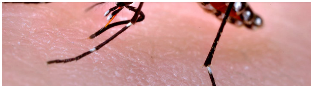
Mosquito aedes aegypti, causante del zika.

Deliciosa receta de coliflor gratinada con jamón