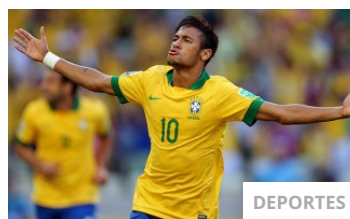
NEYMAR A LA CABEZA