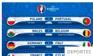
SE PONE LINDO