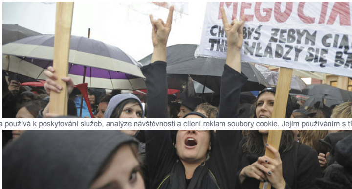
Tisíce polských žen protestovaly proti dalšímu zpřísnění potratů.