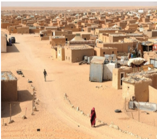
"الصحراء صرخات ملتبهة"

ناشطة الهولندية التي حضرت لمقر الجمعية المغربية لحقوق عززة بفريق من النشطاء الهولنديين و ممثلي سفارة بلدها أن لوك تعرضو له بإسبانيا و البرتغال. و استعرض نشطاء حركة تيات مبادرة سفينة الاجهاض و الهدف من الضجة التي بإدارة. و قالت ابتسام لشكر المتحدثة باسم "مالي" ان الهدف مع وسائل الاعلام هو تصحيح المغالطات التي بتتها وسائل ي كون الحركة ستقوم بعمليات إجهاض للمغربيات في المياه بي حين ان الامر يتعلق بحملة تحسيسية من اجل الحق في الدوائي الامن.