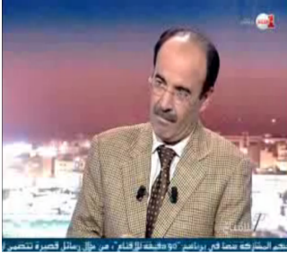
إلياس يضع نفسه رهن إشارة العدالة