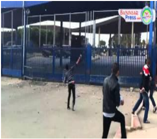
أطفال الحجارة يظهرون بمعبر بني نصار