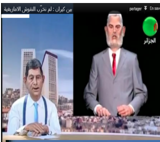
عودة لموضوع النقوش الصخرية