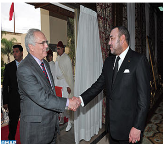
قراءة في استقبال العاهل