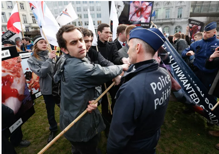
Gegen-Protest in Luxemburg: Pro-Life-Aktivistin.