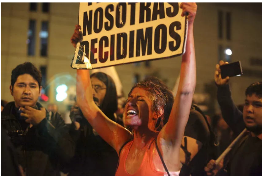
Kampf für die Legalisierung von Abtreibungen in Polen.

Doch auch da kann es Schwierigkeiten geben, manchmal schon allein technisch gesehen, sagt ein Zuhörer: «Manchmal sind die Drohnen so programmiert, dass sie nicht über Grenzen fliegen dürfen», erklärt er. Es gebe aber Drohnen mit freier Software, die das könnten. Solche könne man ja in Zukunft benutzen.