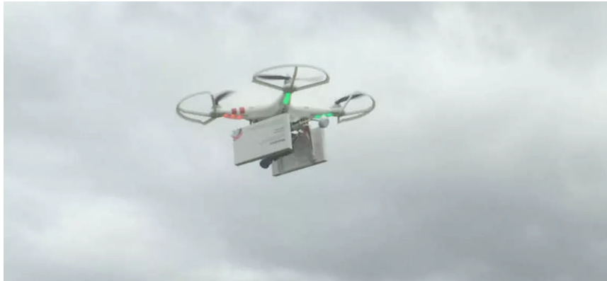
Die Drohne von «Women on Waves».