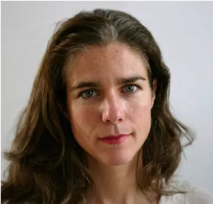
Ärztin Rebecca Gomperts.