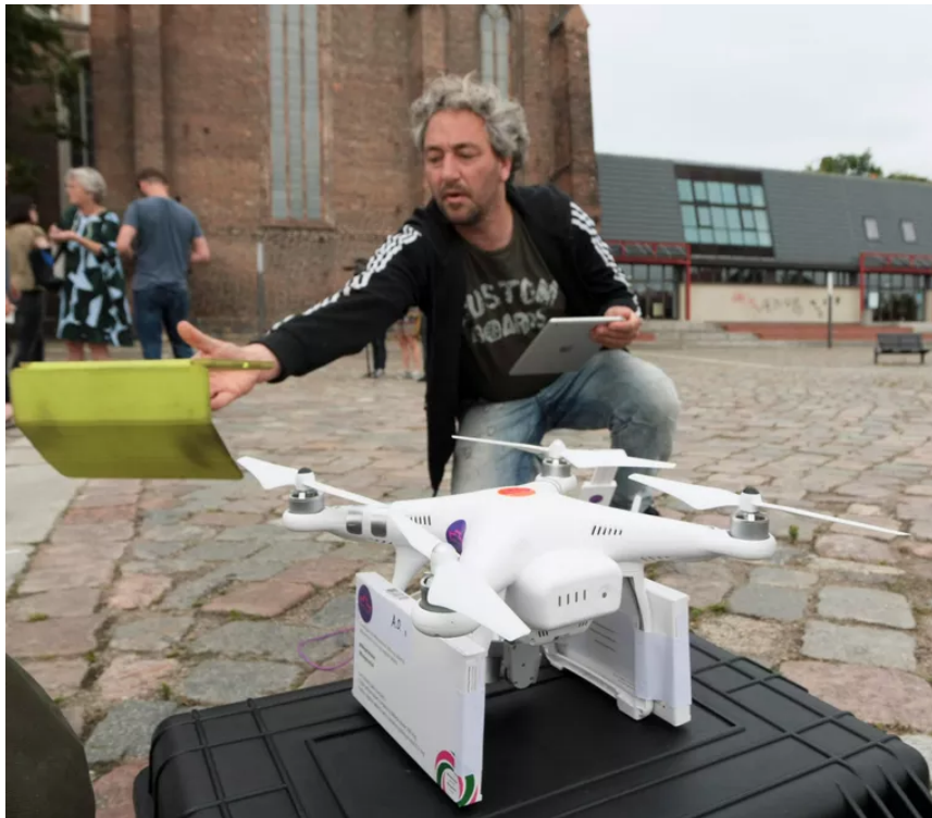
Kurz vor dem Start: Die «Abtreibungs-Drohne».

Eine kleine weisse Drohne ist Ende Juni in Frankfurt an der Oder gestartet und über die Grenze nach Polen geflogen. Das ferngesteuerte Gerät hatte zwei Päckchen mit Abtreibungspillen im Gepäck . Hinter der Grenze warteten zwei schwangere Frauen, sie nahmen die Pillen sofort ein. In Polen sind Abtreibungen verboten. Die Lieferung per Drohne sollte ein Hilfsmittel und ein Zeichen sein – und ein publikumswirksamer PR-Stunt.