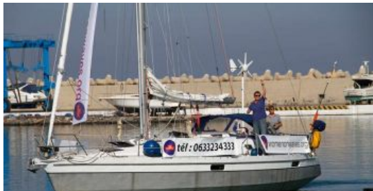
Le bateau de l'association Women on waves.